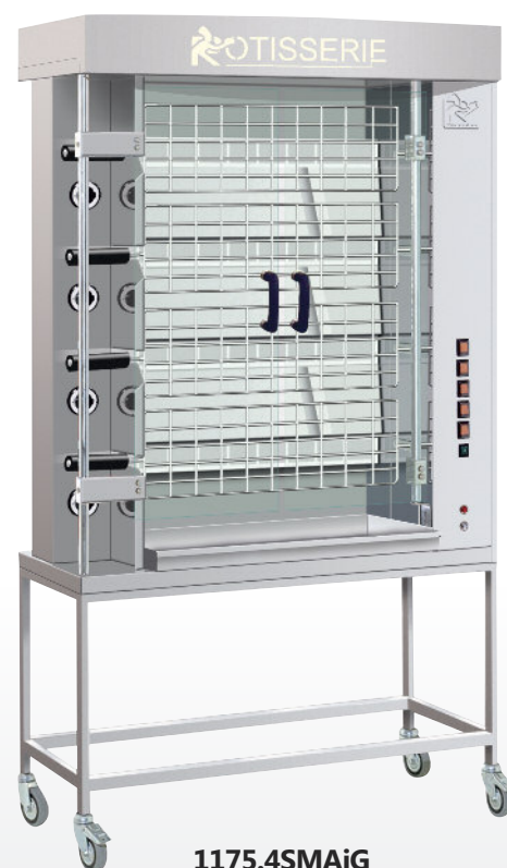
1175.4SMAG Finition inox