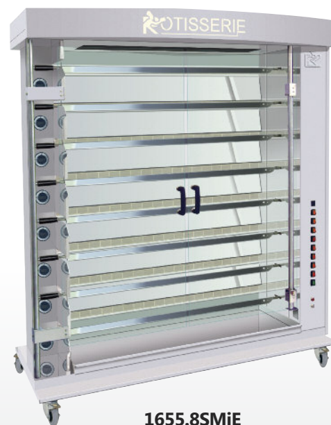
1655.8SMiE Finition inox