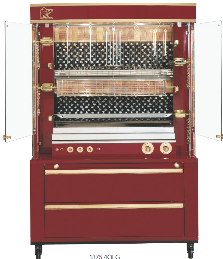
1375.4OLG + 13SBCL + COUL1