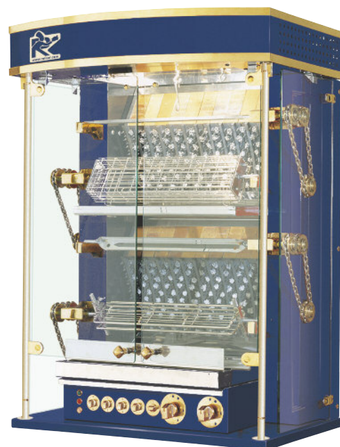
975.4OLG + COUL1

Body in black enamel with brass or stainless steel trim. Rustic rotisserie with chains delivered with 1 vertical spit system. Security glass protection doors with stopping of spits when opened. (safety standard for chain driven motors). Metallic control knobs gas and electric with chrome or brass coating. Interior lighting. Roof include. Delivered with prongless spits (Ref. CUL..., see options and accessories p7 to 12).