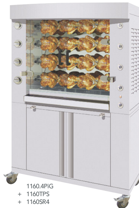
1160.4PiG + 1160TPS + 1160SR4