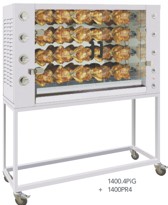
1400.4PiG + 1400PR4