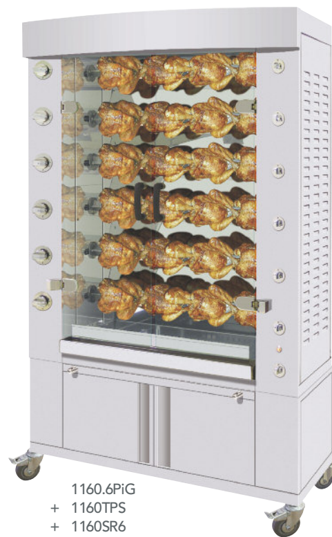
1160.6PiG + 1160TPS + 1160SR6