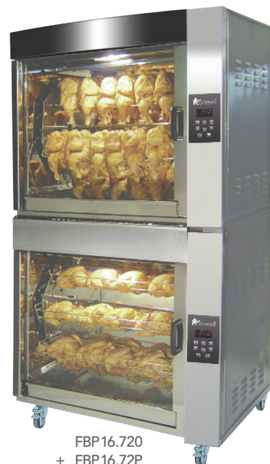
FBP16.720 + FBP16.72P