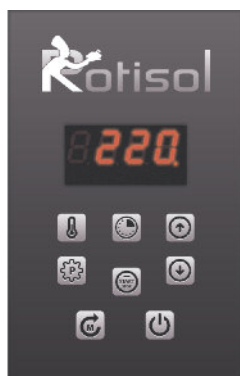
Ecran électronique Digital display