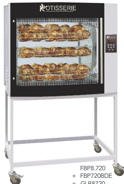
FBP8.720 + FBP720BDE + GLB8720 + FBP8.72PR