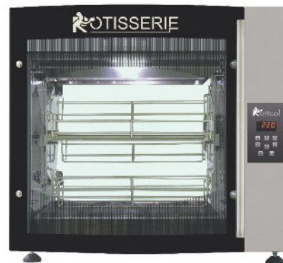
FBP5.520 + FBP520BDE + GLB5520 + FBP.PIED