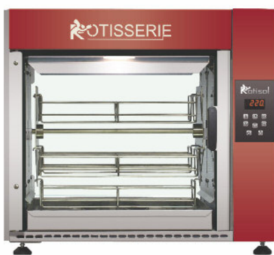
FBP5.520 + FBP520BDE + FBP.PIED + COUL2