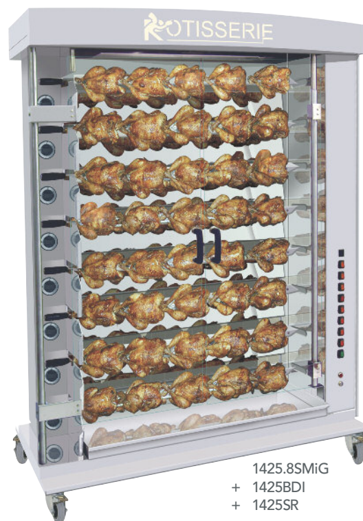
1425.8SMiG + 1425BDI + 1425SR