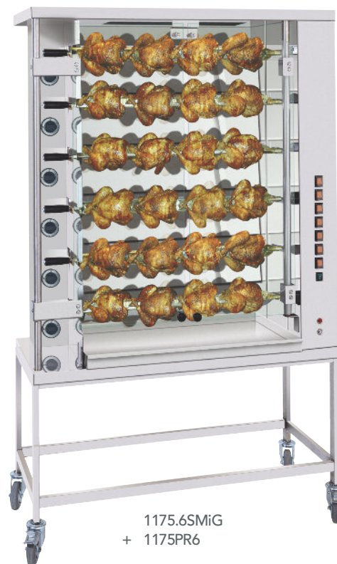
1175.6SMiG + 1175PR6

All stainless steel finish, with independent floating, adjustable motors, by spit. Equipped with glass protection K.GLASS, with blocking when opening and closing. Optional Interior lighting & illuminated roof. Technical compartments protected against infiltration of cooking fats and heat by a double removable panel. Stainless panels removable between burners / heating elements. Delivered with prongless spits (Ref. CUI ... see options and accessories p22 to 23).