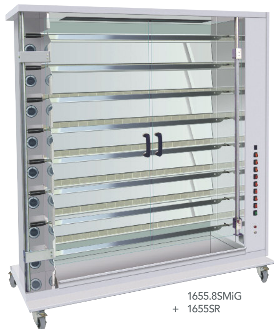
1655.8SMiG + 1655SR