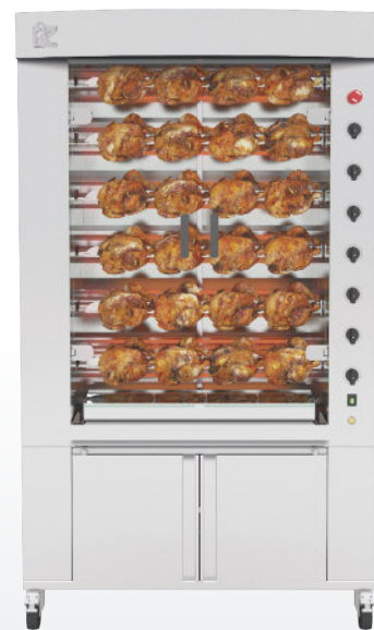
1160.6PiE Finition inox