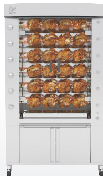
1160.6PiG Finition inox