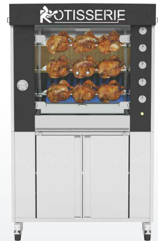
975.2MSG Finition inox