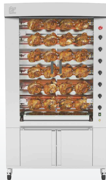
1160.6PiE Finition inox